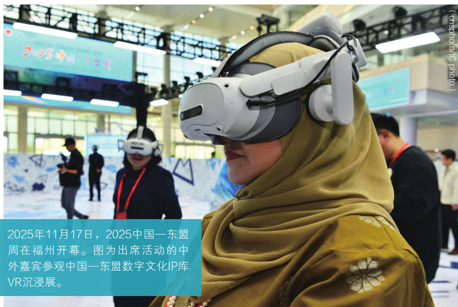
2025年11月17日，2025中国—东盟周在福州开幕。图为出席活动的中外嘉宾参观中国—东盟数字文化IP库VR沉浸展。

一是以践行全球安全倡议、全球治理倡议为抓手，做好顶层设计。重点统筹传统与非传统安全合作，以亚洲方式解决地区冲突，打造全球安全倡议的实验区。同时，在反恐、气候变化、公共卫生、粮食和能源安全、信息安全、生物安全等领域做好制度设计，建立多层次合作机制，快速响应各国差异化的现实需求和挑战。着眼未来重点推进数字经济、人工智能、网络空间、外空等新疆域