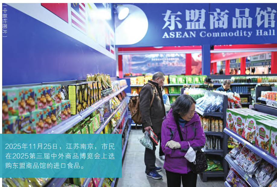
2025年11月25日，江苏南京，市民在2025第三届中外商品博览会上选购东盟商品馆的进口食品。