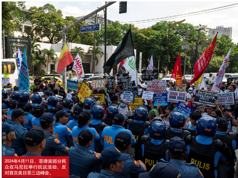
2024年4月11日，菲律宾部分民众在马尼拉举行抗议活动，反对首次美日菲三边峰会。

领导人会议的召开标志着美日菲三方合作朝着机制化建设迈出重要步伐。未来，三方计划持续扩大与深化合作，特别是进行更多的三边人道主义援助、救灾演习以及海岸警卫队的联合演习，等等。在双边层面，日菲将加快签署《互惠准入协议》的进程，美菲则将定期举行“3+3”会