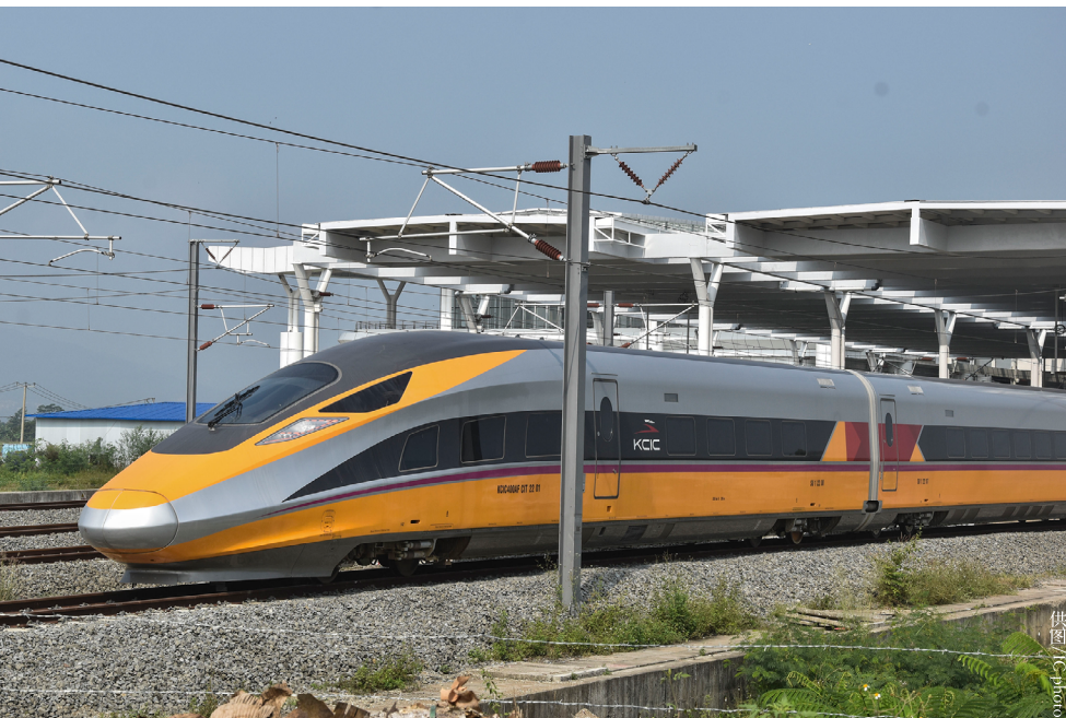
2023年5月24日，中国和印尼高质量共建“一带一路”旗舰项目雅万高铁开始进行运行试验。