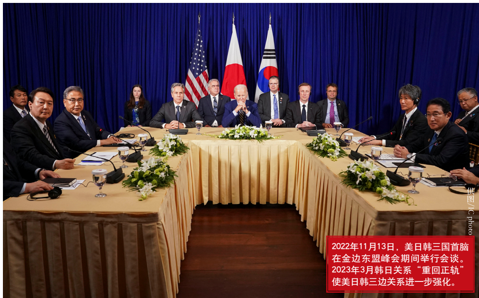
2022年11月13日，美日韩三国首脑在金边东盟峰会期间举行会谈。2023年3月韩日关系“重回正轨”使美日韩三边关系进一步强化。

中美博弈加剧之初，时任韩国总统文在寅坚持战略模糊，避免在中美之间“选边站”，其外交政策更多聚焦朝鲜半岛。然而，乌克兰危机升级很大程度上改写了2022年韩国大选结果，也改写了韩国的内政外交走向。5月尹锡悦政府执政后，提出要