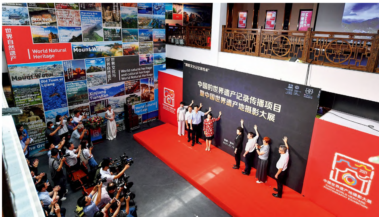
· 2021年7月16日，中国的世界遗产记录传播项目暨中国世界遗产地全国摄影大展在福州展出。本次展览按世界自然遗产、世界文化遗产、世界自然与文化双遗产以及福建单元四大板块分类，共展出260多位摄影家拍摄的摄影作品。图为摄影展启动仪式。中新社记者 吕明 / 摄

国不同的价值观、世界观和知识，包括科学知识、本土知识和地方知识。人类社会同处一个地球上，应对气候变化毫无疑问需要强有力的政治承诺、协调一致的政策以及实实在在的国际合作。