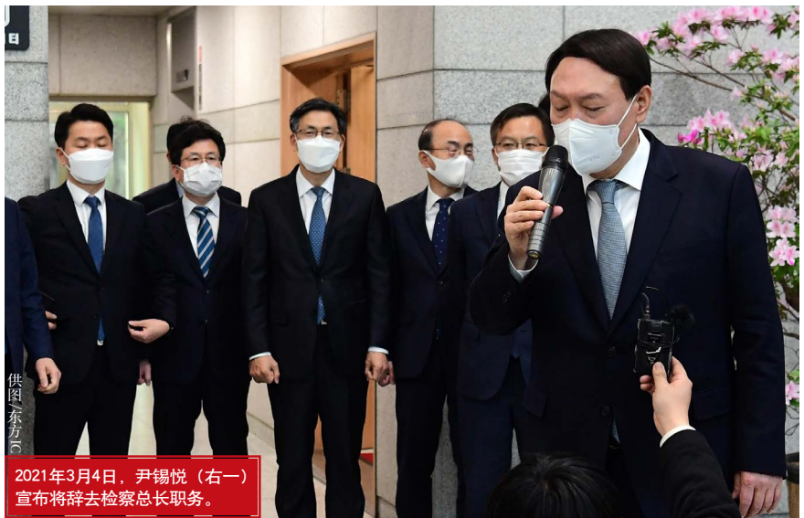
2021年3月4日，尹锡悦（右一）宣布将辞去检察总长职务。

虽然检察机关通过中央搜查部和特殊搜查部等，对公职人员牵涉案件进行了大量调查，但学界和进步势力及其舆论仍批评检察机关