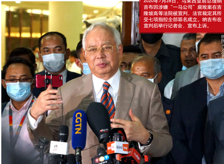
2020年7月28日，马来西亚前总理纳吉布因涉嫌“一马公司”腐败案在吉隆坡高等法院被判刑，法官裁定其所受七项指控全部罪名成立。纳吉布在宣判后举行记者会，宣布上诉。

以穆尤丁为总理的现任国民联盟政府，由土著团结党、国民阵线（国阵）、伊斯兰党、沙捞越政党联盟（GPS）、沙巴团结党、沙巴立新党组成，在国会222个议席中占据114个，勉强获得过半数议席执政。在国阵中，巫统有39个议席，为执政联盟中最大的政党，总理慕尤丁领导的土著团结党只有31个议席。由于巫统多名领袖涉及多起贪腐案件，巫统高层人人自危，这次判决无疑是对其高层的警告，将巩固土