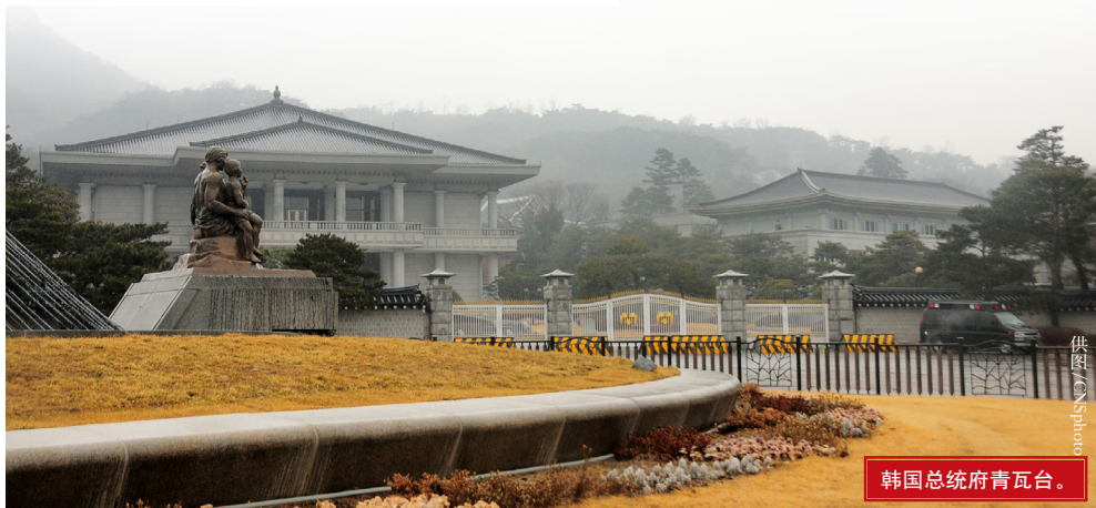
韩国总统府青瓦台。

美国邀请韩国加入这个扩容构想，是因为它认定韩国对于实现围堵中国的目标将起到非常重要的作用。从经济方面来看，韩国是中国重要的贸易伙伴。据中国海关统计，中韩双边贸易额从1992年建交时的50.3亿美元，大幅增至2019年的2845.4亿美元。从2003年起，中国取代美国成为韩国最大的出口对