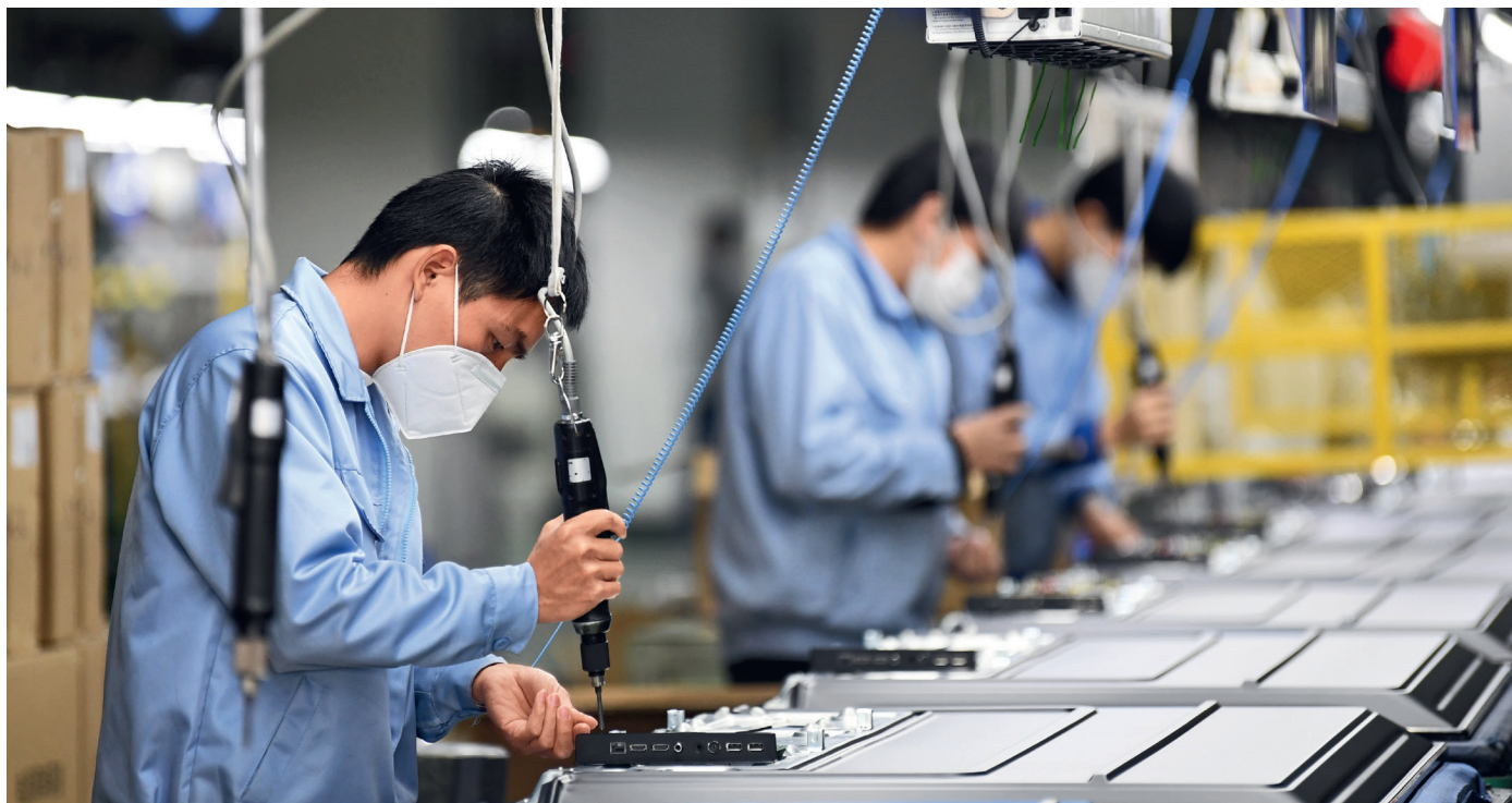
2月10日，位于广州开发区的广州创维平面显示科技有限公司生产车间内，工人佩戴口罩在流水线上作业。