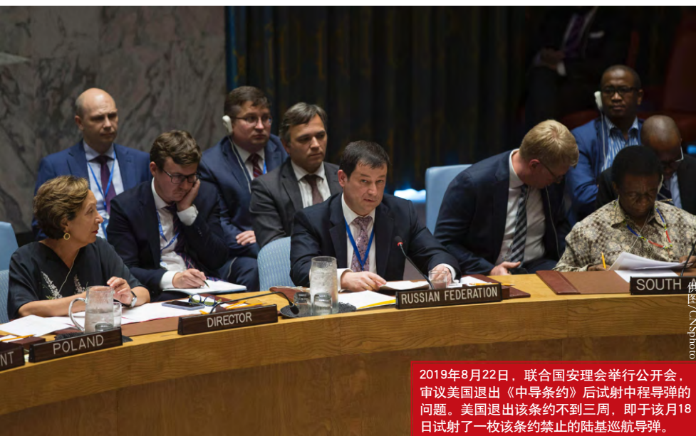
2019年8月22日，联合国安理会举行公开会，审议美国退出《中导条约》后试射中程导弹的问题。美国退出该条约不到三周，即于该月18日试射了一枚该条约禁止的陆基巡航导弹。

推进一个共同构想》两份报告，全面涵盖了经济、安全、意识形态等领域。从实际推进来看，“印太战略”在安全领域“成绩”突出，在经济领域则颇有争议性。美国究竟有无意愿和能力为本地区提供基础设施领域的“可替代性”方案与资金，这不仅为地区国家所质疑，也引起了美国学者的高度怀疑。