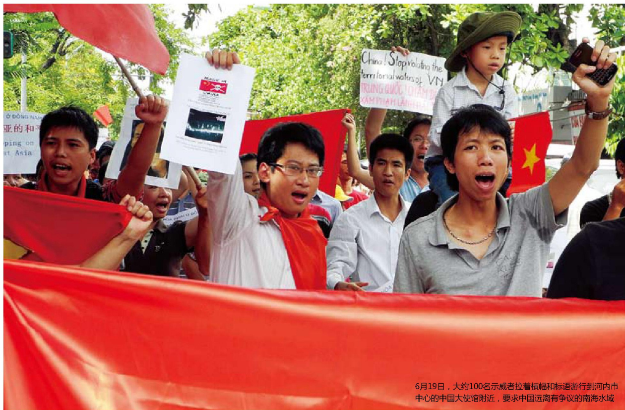
6月19日，大约100名示威者拉着横幅和标语游行到河内市中心的中国大使馆附近，要求中国远离有争议的南海水域