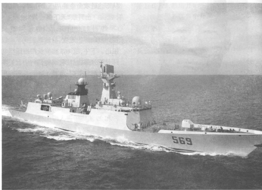
南海舰队导弹护卫舰

当时的中国政府，正处在内外交困之中。一方面，日本军队自1931年发动“九一八”事变占领东三省后，仍