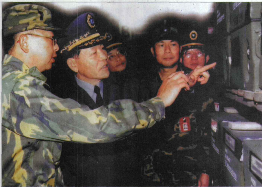
“老虎部队”隶属于台军“参谋本部”通资指挥部，地位又十分特殊，因此高层领导对其自然关爱有加。图为时任“副参谋总长”的霍守业在老虎部队视察工作。

系列网络专项计划，在全球设立了数十个网络情报工作据点，以我周边国家为主阵地，采用狼群战术进行网上窃密和情报渗透。