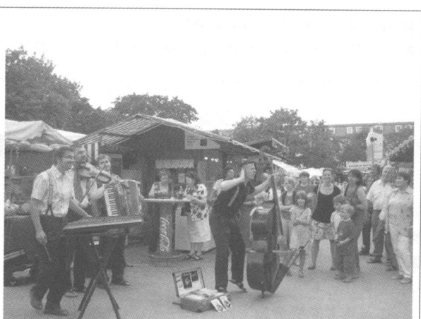
随处可遇的精彩的艺术表演