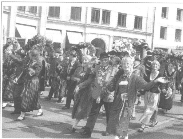
著名的啤酒节游行

如今,从地图上看整个内城其轮廓依旧清晰可辨,原本不大的内城(东西、南北主干道步行均约半个多小时的路程)依然充满活力,依然是慕尼黑当前和未来城市发展和市民生活中最具代表性的空间场所,因此,内城事实上就是这座享誉世界的现代都市的“心脏”。慕尼黑曾经的官方城市格言——“有心脏的世界城市”,也许就与此相关。这里随处可见的街头表演,转角处的音乐,仍在继续的传统节日,古老的博物馆的珍贵藏品,时尚的现代生活,有点狭窄的内城街巷,高度发达便捷的现代立体交通体系,凡此等等,都使得慕尼黑内城“成了座无尽的宫殿”,成了人们了解和体验慕尼黑最为重要的空间场所。