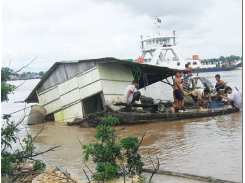
ផ្ទះមួយនេះកំពុងត្រូវបានសង្គ្រោះបន្ទាន់បំបាត់ប្រាំងធ្លាក់ចូលទឹកទន្លេនៅអ្នកលឿង។ សូរិសាល