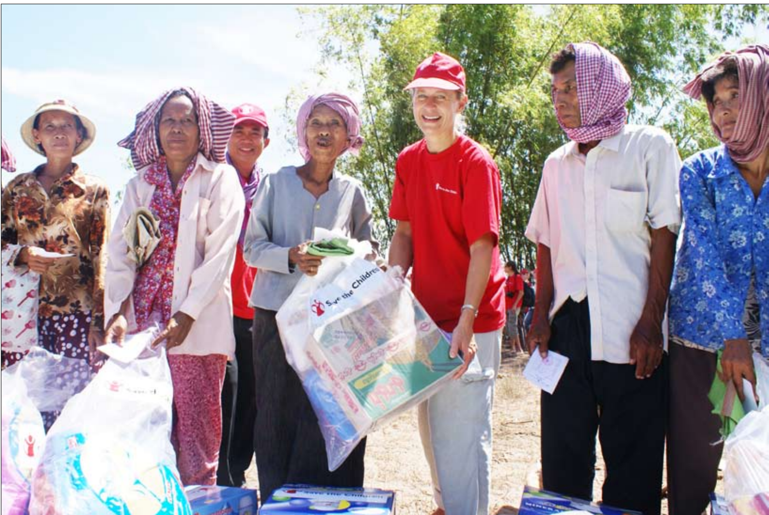
Jasmine Whitbread ( ទីបីខាងស្តាំ ) នាយកប្រតិបត្តិអង្គការ Save the Children International ចែកអំណោយទៅដល់ប្រជាពលរដ្ឋដែលរងគ្រោះដោយទឹកជំនន់។

ការខូចខាតហេដ្ឋារចនាសម្ព័ន្ធដទៃទៀតដោយសារទឹកជំនន់បច្ចុប្បន្ននៅពុំទាន់ដឹងនៅឡើយទេ។ អ្វីដែលយើងបានដឹងគឺថា វានឹងត្រូវការពេលវេលានិងធនធានយ៉ាងច្រើនដើម្បីធ្វើឲ្យ