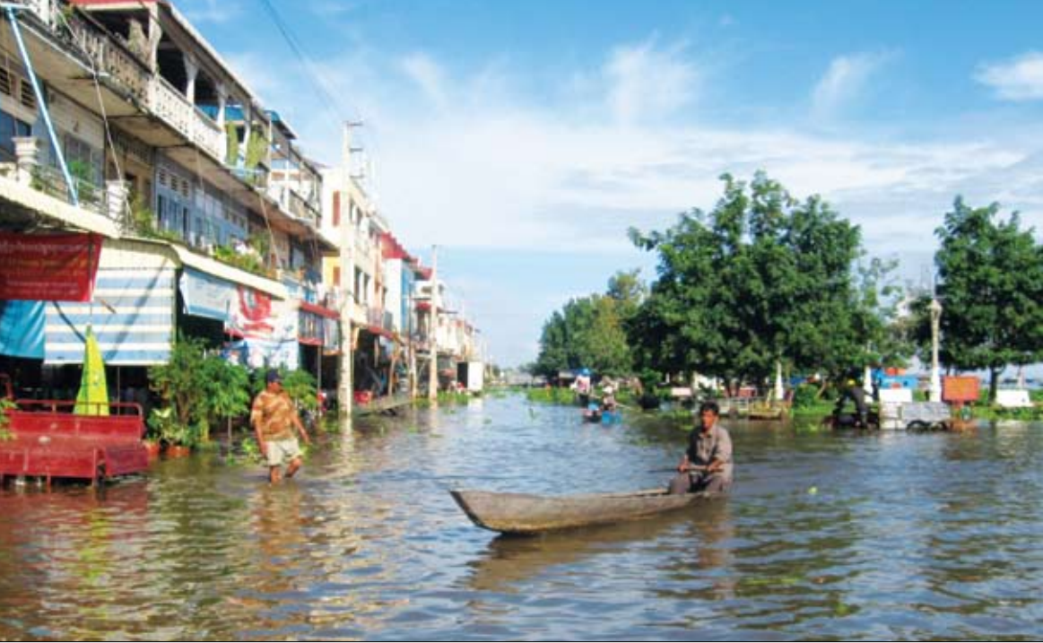
ផ្ទះរបស់ប្រជាពលរដ្ឋជាច្រើនរយខ្ពងនៅក្នុងកំពង់ឆ្នាំង ខេត្តកំពង់ឆ្នាំងត្រូវបានទឹកជំនន់លិច។

កត្តាទី ២ នាំឲ្យមាននិចលភាព គឺការ ផ្តល់សារៈសំខាន់យឺតពេលវេលាដល់ការ ផ្សំនិងការប្រែប្រួលអាកាសធាតុប្រៀប ប្រធៀបនឹងការសម្រាលការប្រែប្រួលអាកាស ធាតុ។ ខណៈការសម្រាលការប្រែប្រួល