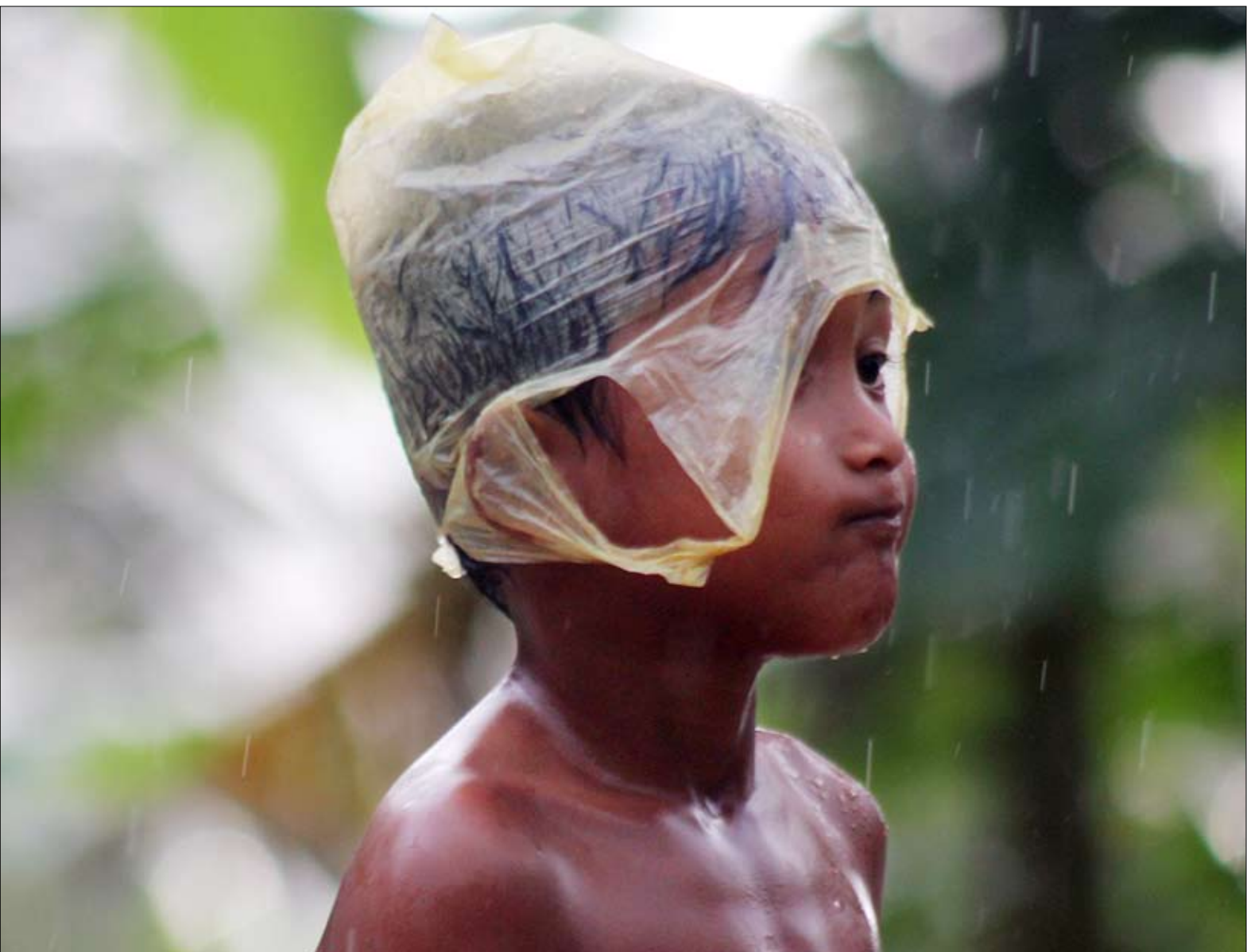
កុមារម្នាក់នេះ កំពុងទទួលបានសេវាសង្គ្រោះនៅក្នុងភូមិសង្កាត់កោះដាច់ ខណ្ឌបូស្រីកែវ រាជធានីភ្នំពេញកាលពីពេលថ្មីៗនេះ។

ឥឡូវនេះ អង្គការបានប្តូរទៅដំណាក់ កាលស្តារឡើងវិញ ដែលនឹងមានរយៈ ពេលរហូតដល់ ១ ឆ្នាំ និងចំណាយប្រាក់ ប្រហែល ២៥០ ០០០ ដុល្លារអាមេរិក។ ទន្ទឹមនឹងនេះ លោក ហេង សុខ អ្នកឯក- ទេសកាត់បន្ថយគ្រោះមហន្តរាយរបស់