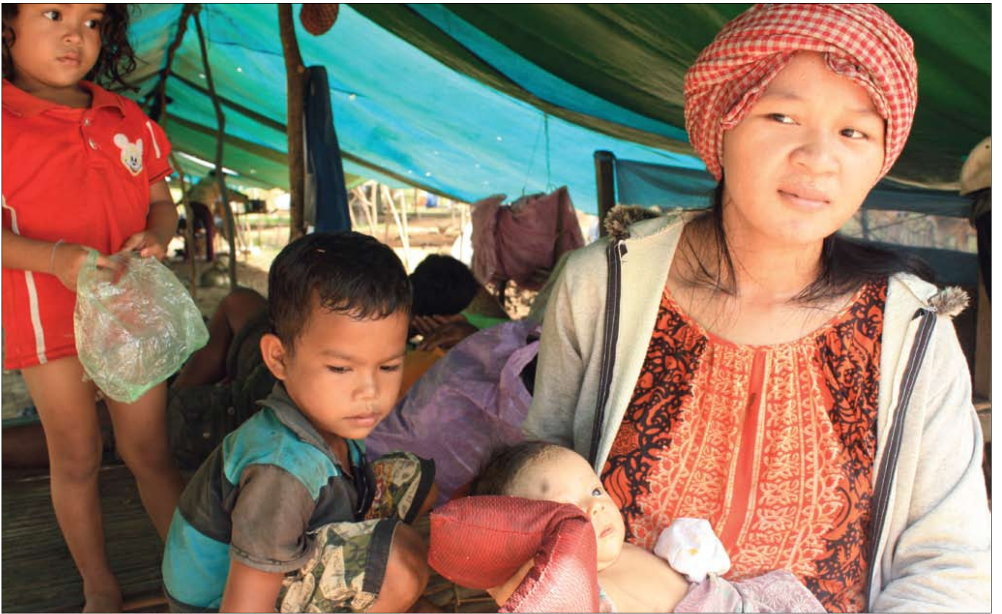
ក្រុមគ្រួសារមួយនេះដែលមានកូនតូចៗ កំពុងតែរស់នៅក្នុងតង់ដែលសម្រាប់ជនភៀសខ្លួនដោយសារទឹកជំនន់នៅខេត្តកំពង់ធំ។