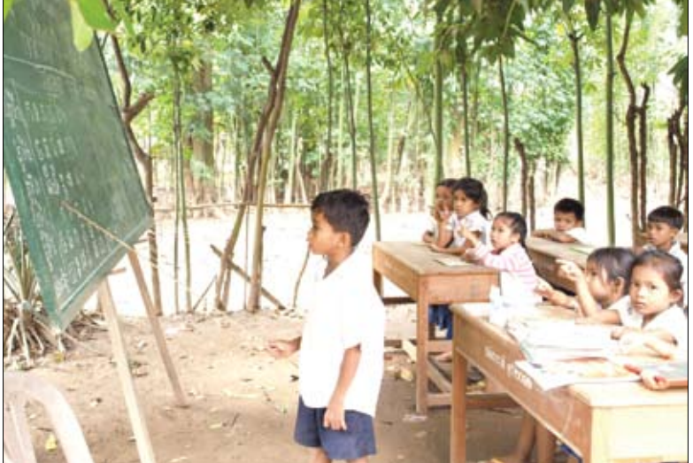
ក្មេងៗទាំងនេះដែលប៉ះពាល់ដោយទឹកជំនន់នៅកំពង់ចាម កំពុងទទួលបាននូវការអប់រំនៅសាលារៀនបណ្តោះអាសន្នដែលបង្កើតឡើងដោយអង្គការ Save the Children។

ការងារដើម្បីឡើងវិញពីគ្រោះមហន្តរាយក្នុងទំហំធំនេះនឹងត្រូវការពេលវេលាហើយប្រសិទ្ធភាពនឹងត្រូវគេឃើញចាប់ផ្ដើមមានក្នុងរយៈពេលយូរក្រោយដីស្រែចម្ការលែងជន់លិច។ ដំណោះស្រាយដែលត្រូវការចំណាយតិចតែមានភាពច្នៃប្រឌិតអាចផ្តល់អត្ថប្រយោជន៍ដល់ប្រជាពលរដ្ឋក្នុងទំហំធំ។ អង្គការ Save the Children កំពុងសម្លឹងទៅរកការបន្តពង្រឹងកិច្ចសហប្រតិបត្តិការរបស់ខ្លួនជាមួយរដ្ឋាភិបាល អង្គការមិនមែនរដ្ឋាភិបាល អង្គការសហប្រជាជាតិ និងសហគមន៍ម្ចាស់ជំនួយដើម្បីរួមគ្នាកាត់បន្ថយហានិភ័យ និងធ្វើឲ្យវត្តមានប្រសើរឡើងនូវអនាគតដ៏ល្អមួយសម្រាប់កុមារដែលរងគ្រោះដោយសារទឹកជំនន់ និងក្រុមគ្រួសាររបស់ពួកគេ។ នេះ គឺជាវិធីតែមួយគត់ដើម្បីឆ្ពោះទៅមុខបន្តទៀត។ CR