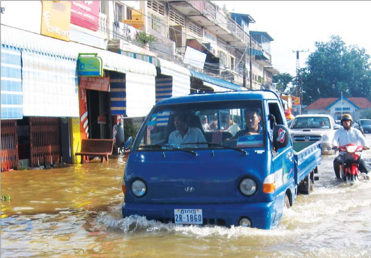
ទឹកជំនន់ធ្លាក់នេះ បានធ្វើឲ្យផ្លូវព្រៃក្រោមទៅផ្សារលើទីក្រុងកំពង់ឆ្នាំងត្រូវបានលិចទាំងស្រុងរួមទាំងផ្ទះសំបែងរបស់ប្រជាពលរដ្ឋជាច្រើនយកខ្លួន មន្ទីរពេទ្យ សាលារៀនជាដើម។

ផ្លូវថ្នល់ និងប្រព័ន្ធធារាសាស្ត្រនៅតាមជនបទ ក៏ទទួលរងគ្រោះយ៉ាងអាក្រក់ផង