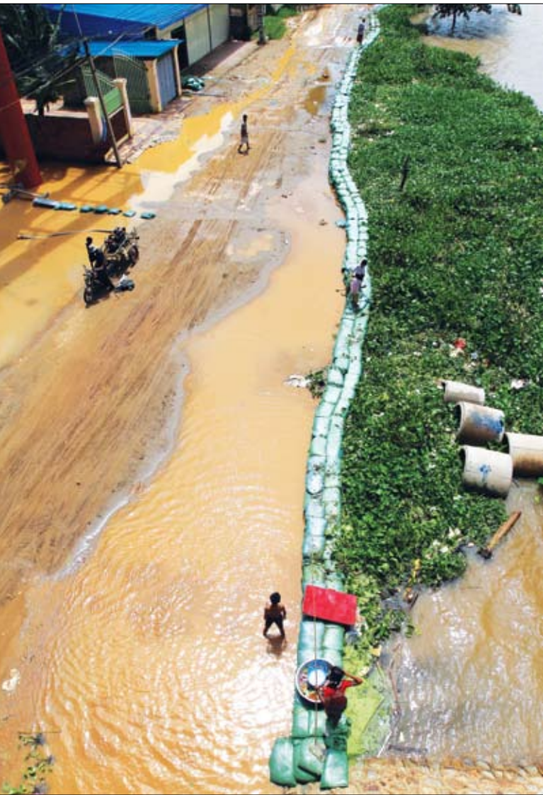
ប្រជាពលរដ្ឋនៅខណ្ឌបុស្សីកែវបានយកកាតុងខ្សាច់ដើម្បីទប់ទឹកជំនន់។

មូលនិធិក៏ជួយលុបបំបាត់គម្លាតមុននឹងមានជំនួយកសាងឡើងវិញក្នុងរយៈពេលវែងនៅក្រោយគ្រោះមហន្តរាយ និងការផ្តួចផ្តើមការកាត់បន្ថយហានិភ័យគ្រោះមហន្តរាយ។ DT